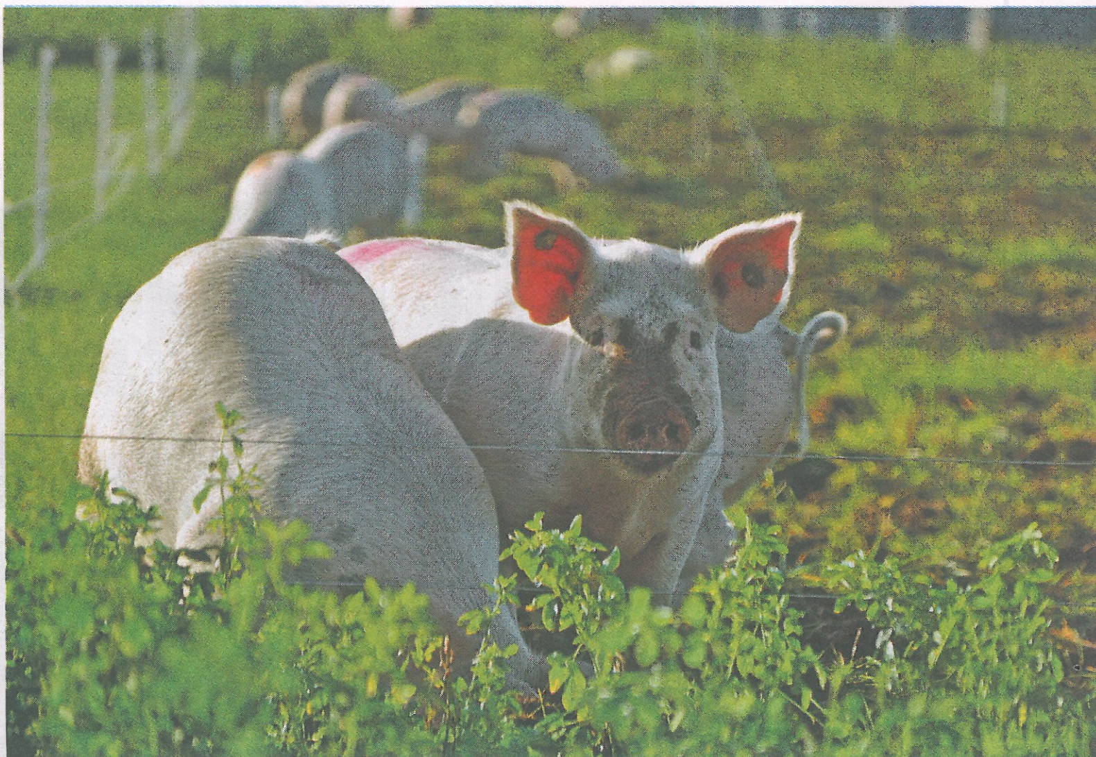
Stribegræsning motiverer til reel afgræsning. Svinene optog 2,5 kg lucerne dagligt som supplement til et foder bestående af byg, hvede og havre i et Core Organic II projekt, der arbejder på at udvikle 100 pct. økologiske foderstrategier til svin og fjerkræ.

Økologi & Erhverv tager forbehold for evt. fejl.